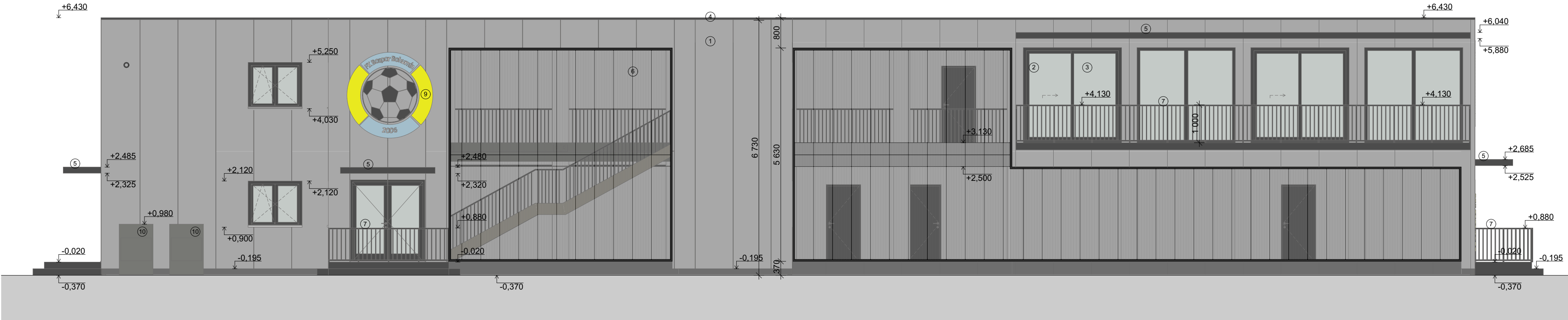
Pohled západní PIR panel 1:80

Dokumentace je vypracována ve stupni dokumentace pro provádění stavby (DPS) a slouží jako podklad pro výběr dodavatele. Některé části návrhu, zejména detaily konstrukčního a technického řešení, budou dále rozpracovány v rámci výrobní či realizační dokumentace zhotovitele. V této následné dokumentaci bude rovněž docházet k upřesnění konkrétních parametrů stavebního díla, včetně požadavků investora. V rámci tohoto procesu může dojít k drobným odchylkám oproti této dokumentaci, které však nesmí být v rozporu s jejím základním řešením a účelem.